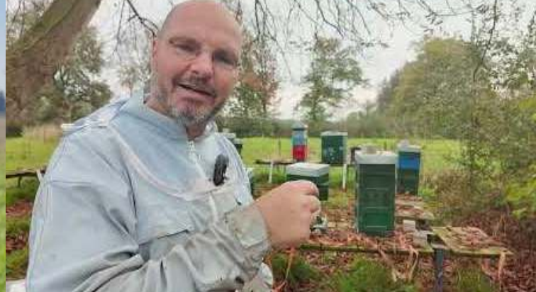
NÜRTINGEN SA. 14. MÄRZ 2026