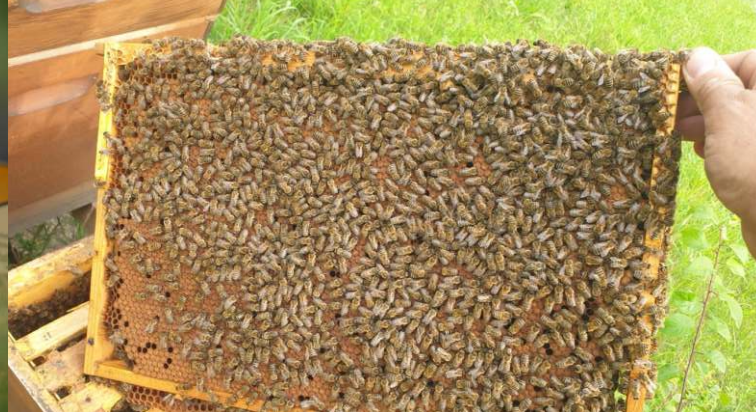
RIESCHWEILER SA. 17. JANUAR 2026