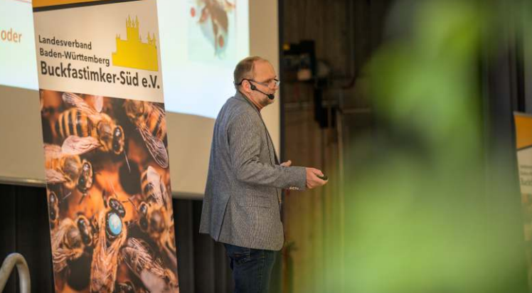
BERG SA. 10. JANUAR 2026