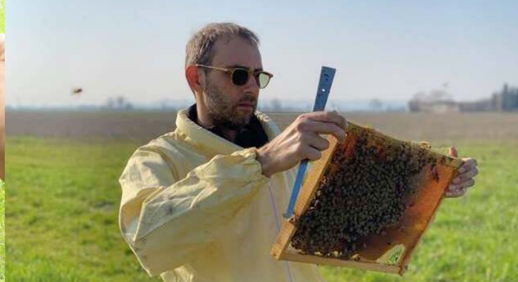
BIBERACH A.D. RIß SA. 28. FEBRUAR 2026