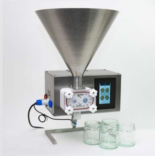
Trichteraufsatz Kleinstmengentrichter für kleine Chargen oder Mischhonige. Hygienisch und zeitsparend.

Imkerei Bienen Bayer Wörrhof Weg 16 93128 Regenstauf