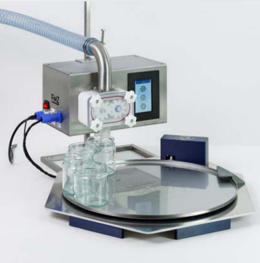
Drehteller Automatisches Zuführen der Gläser – ideal für Serienabfüllung. Robust, leise, effizient!

Mit dem passenden Zubehör wird dein FMZ-Honigabfüllgerät zur echten Produktionslinie: Ob Drehteller für automatisches Abfüllen oder Trichter für komfortables Befüllen – alle Komponenten sind perfekt aufeinander abgestimmt und sofort einsatzbereit.